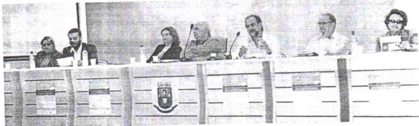
Autoridades participaram da abertura do fórum

OSÓRIO - A realização do Fórum Gaúcho pela Melhoria das Bibliotecas Públicas, na última sexta-feira, dia 14, reuniu mais de 160 participantes, vindos de cidades como Capão da Canoa, Imbé, Tramandaí, Xangri-Lá, Santo Antônio da Patrulha, Cachoeirinha, Porto Alegre, Novo Hamburgo, São Leopoldo, Bento Gonçalves e Osório. O evento foi uma grande troca de experiências entre bibliotecários de várias cidades com o objetivo de valorizar um local que é fonte de cultura, lazer e conhecimento para toda a